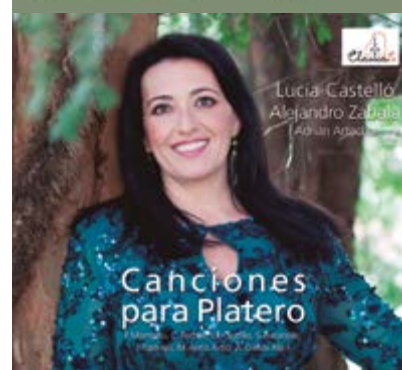
Grabaciones de ClasicasEs

presenta el aliciente añadido de dar a conocer en primera grabación dos obras prácticamente desconocidas de Falla.